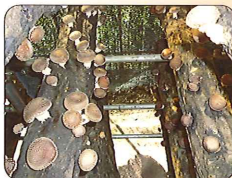
現在約1300本の原木で栽培してます

こんなに大きな椎茸が採れます。とても肉厚で「肉詰め」「ホイル焼き」などでおいしく食べられます。