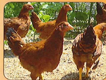
凛々しい姿に成長しました

比内地鶏は春に400羽の雛を入荷し、出荷を迎える10月頃まで大切に心を込めて育てています。