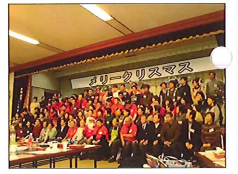
たくさんの方との交流がありました

12月6日、北秋田市障害者支援センターささえ主催のクリスマス会へ利用者6名が参加しました。会場の飾りつけや食事の準備などを役割分担し他の参加者と協力し合っ