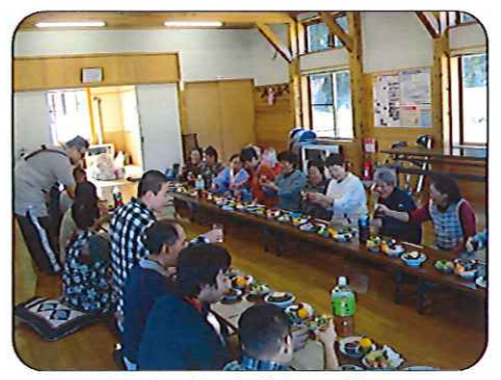
みんなで作っただまっこ鍋。おいしくいただきました