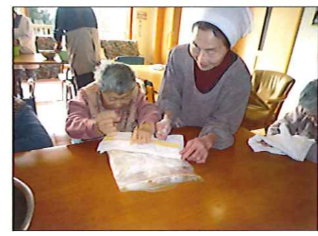
協力しながらご飯をつぶします

炊き立てのご飯が入った袋の上から力を入れて棒や手でご飯をつぶしている、袋が破けてしまいうハプニングも。破れた