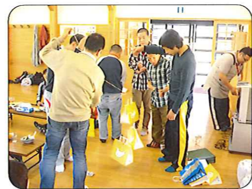
どれにしようかな?

と残念がる利用者の方もいましたが、「手に水をつけてから丸めると大丈夫だよ」と優しくアドバイスをもらいチャレンジすると、きれいな丸いだまっこができました。完成した温かいだまっこ鍋を食べた後は、ビンゴゲームや宝引きで盛り