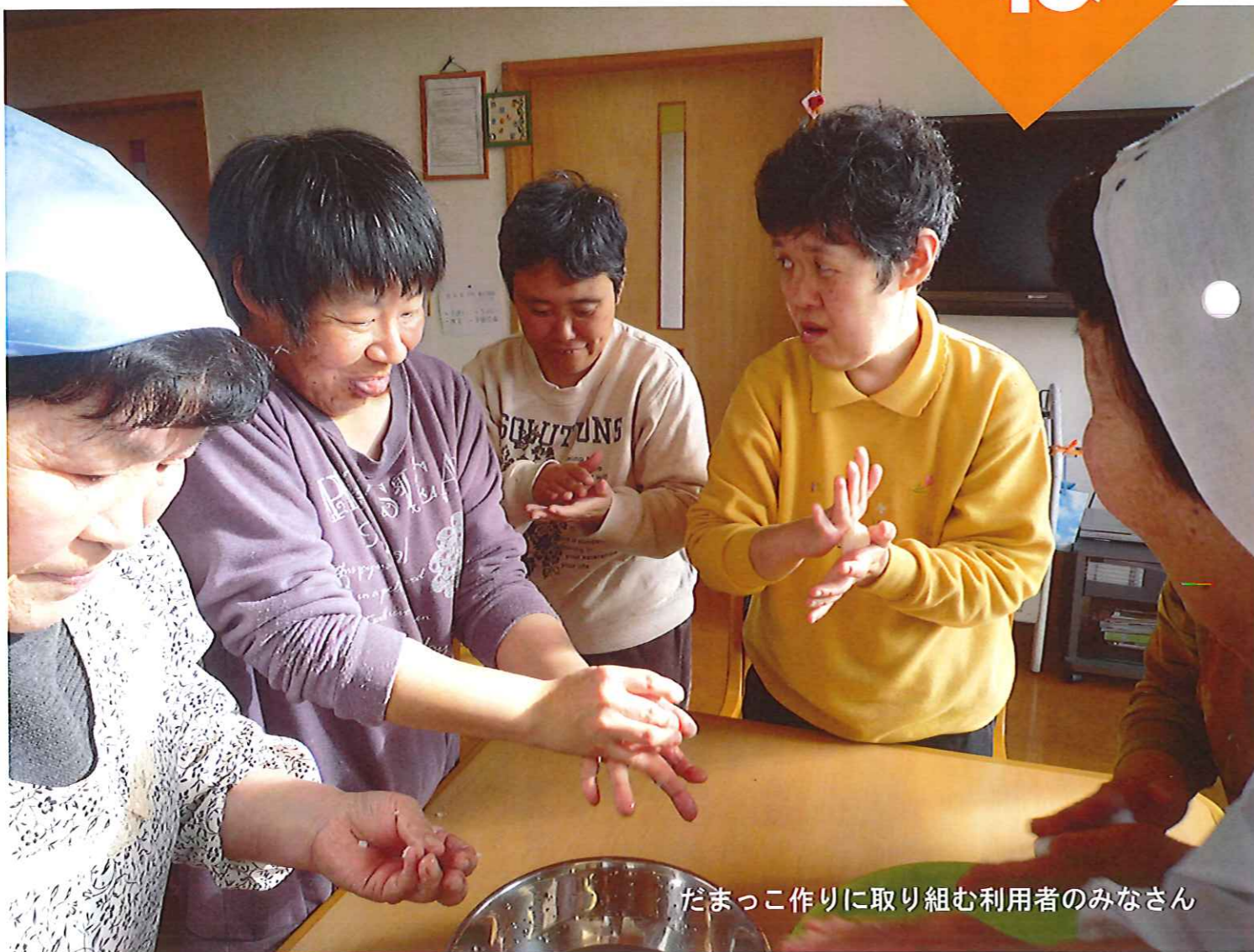
だまっこ作りに取り組む利用者みなさん