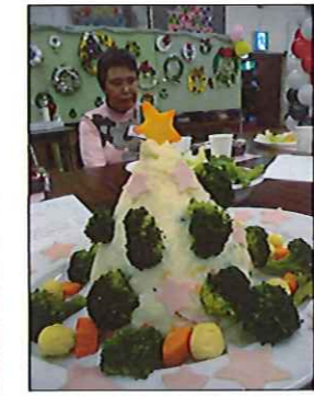
ツリー型のサラダも登場

12月6日、北秋田市障害者支援センターささえ主催のクリスマス会へ利用者6名が参加しました。会場の飾りつけや食事の準備などを役割分担し他の参加者と協力し合っ