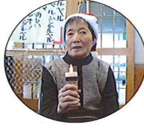
キャンドルライトに願いをこめて

12月13日、思いやり自治会主催のクリスマス会が訓練・作業室で行われ、日中活動利用者85名が参加しました。