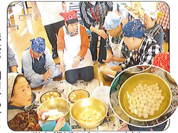
つぶしたご飯を手のひらでコロコロと丸め、たくさんのだまっこ完成!!

参加しました。だまっこ作りでは「僕、やってみたい」と目を輝かせながら積極的に挑戦する利用者もおり、終始明るい雰囲気の中行われました。手にご飯がくつき「上手にできない」