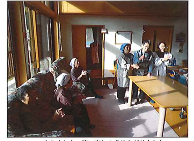
カラオケも一緒に楽しみ盛り上がりました

ンの方から「こうすると丸くなるよ」と教えてもらいながら行い、あつという間に完成。鍋ができるまで行ったカラオケでは、サロンの方と一緒に手拍子にのって歌う利用者からは「すごく楽しい」という声も