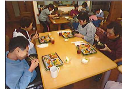
ブルを囲み一緒に食べました

ンの方から「こうすると丸くなるよ」と教えてもらいながら行い、あつという間に完成。鍋ができるまで行ったカラオケでは、サロンの方と一緒に手拍子にのって歌う利用者からは「すごく楽しい」という声も