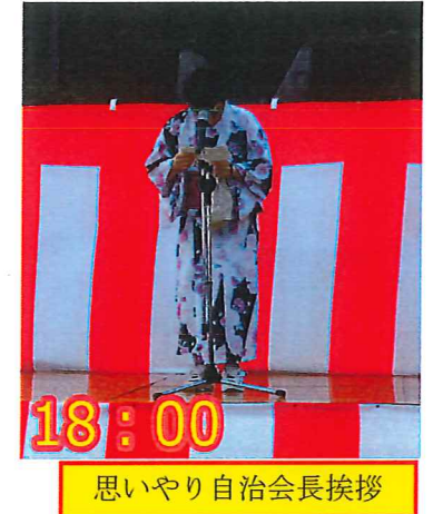
18:00 思いやり自治会長挨拶

イベント会場ではこの自慢大会、音楽クラブによる歌と踊り、前小ロックソーランなどの催し物が行われ、会場全体が盛り上がり、一体感に包まれました。模擬店も盛況で、それぞれのテントの前には順番を待つ列ができていました。また、森幸園25周年を記念して、敷地で打ち上げられた花火の圧巻の迫力を楽しみながら、森の夕べは終演を迎えました。