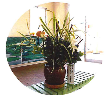
夕涼みをイメージした生け花クラブの作品