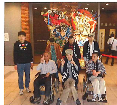
立佞武多の館で記念写真