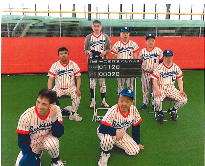
みんな、がんばりました