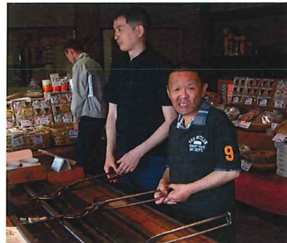
せんべいを焼いています