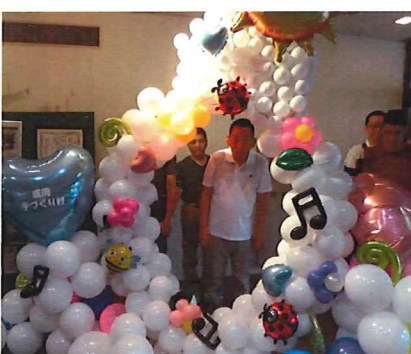
手づくり村でのひとコマ