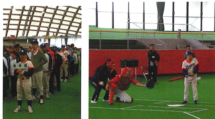
開会式の様子 ソフトボールの様子

6月13日の県北で球技大会ではソフトボールとスカットボールが行われ、利用者18名が参加しました。ソフトボールではランニングホームランなどの活躍もありましたが、惜しくも負けてしまいました。スカットボールでは皆が高得点を出し、昨年よりも上位にランクしました。