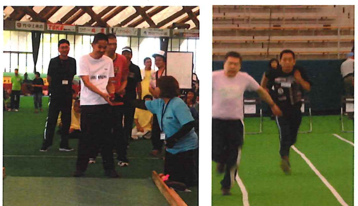
ゲートボーリング 50メートル走