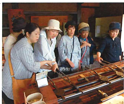
せんべい焼き体験中