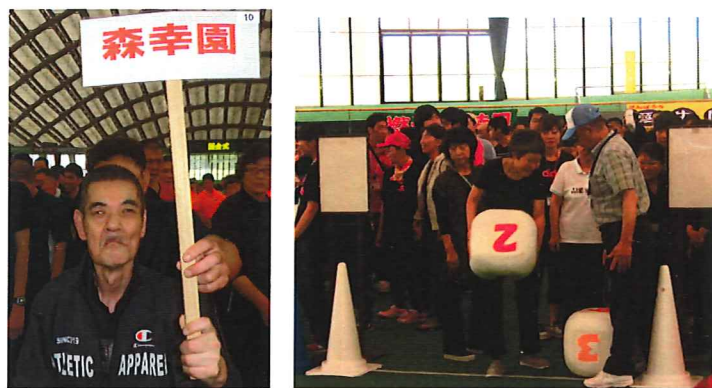
開会式の様子 サイコロ転がし

7月11日の県北レクリエーションでは、森幸園利用者11名、もりの郷利用者9名が参加しました。50メートル走、フライングディスク、サイコロ転がしなどの個人競技と、ゲートボーリング、玉入れ競争などの団体競技があり、それぞれの競技に分かれて頑張っていました。