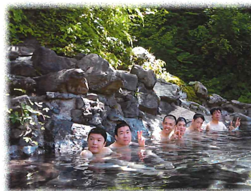
温泉を楽しむ利用者たち

5月26日、27日に森幸園でケーブル工事が行われました。ケーブル工事がスムーズに行えるよう、工事時間中はそれぞれのユニットで外出を計画し、出掛けています。あすなる・やまびこ街では温泉外出を計画し、杣温泉へ出かけました。当日は天気も良く、露天風呂を満喫して充実した一日を過ごしてきました。