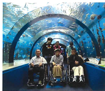
浅虫水族館、水中トンネル