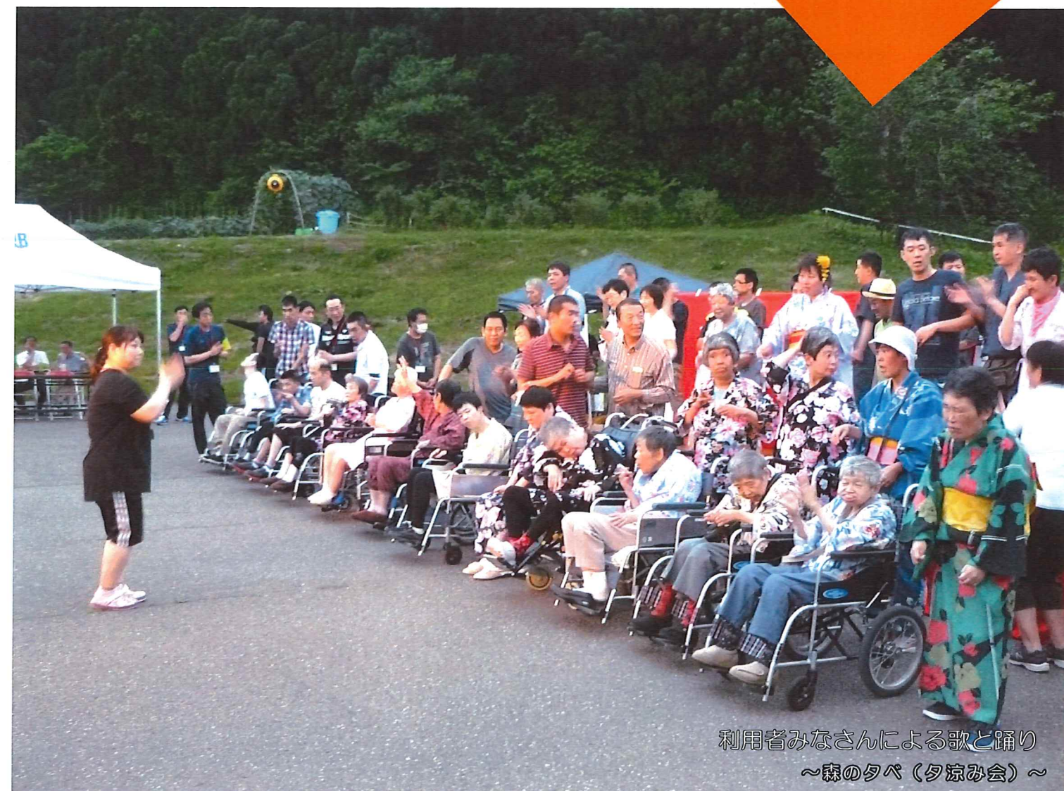
利用者みなさんによる歌と踊り ～森の夕べ（夕涼み会）～