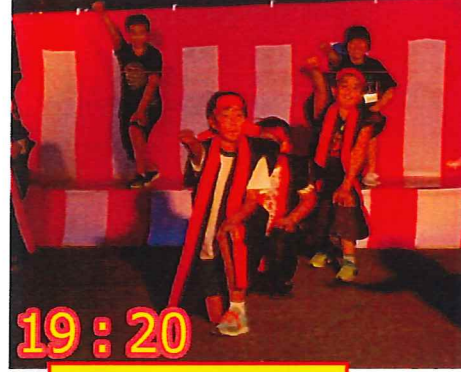
19:20 前小ロックソーラン