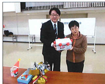
みんなの気持ちを託してきました

12月11日、「私たちも参加しよう募金活動」のとりまとめ会が秋田県社会福祉会館で行われ、小竹自治会長が出席し「役立ててください」と手作りの募金箱に自治会役員が中心となって集めた募金を手渡しました。