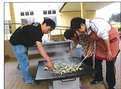
焼く担当の利用者のみなさん

9月23日、正面玄関や作業訓練室でパーベキューを開催し、利用者36名が参加しました。