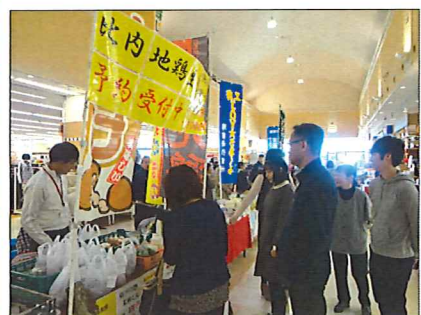
行列ができるほど好評でした

参加した利用者は「いらつしやいませ」「ありがとうございしました」と大きな声と満面の笑みで接客