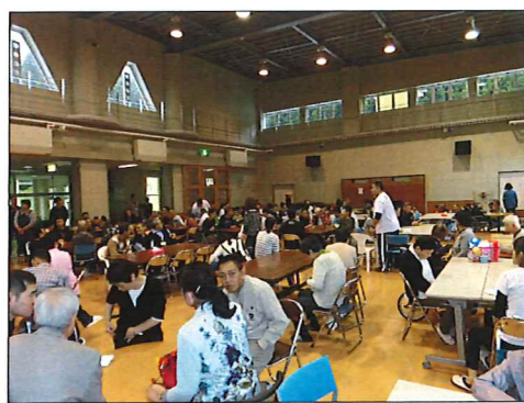
たくさんの人で賑わった昼食交流会