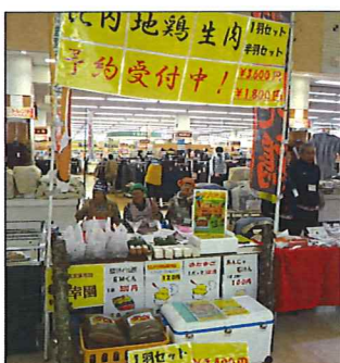
生産品を並べお客様を待ちます

10月28日、鷹巢いとくシヨッピングセンターで行われた「福祉製品フェア」に森幸園も出店し利用者3名が参加してきました。