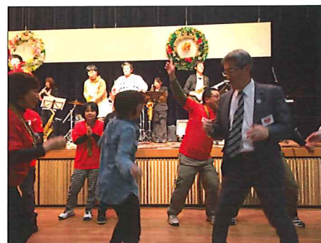
音楽や踊りで楽しんだクリスマス会

12月9日、北秋田市障害者支援センターささえ主催のクリスマス会が行われ、利用者5名が参加してきました。