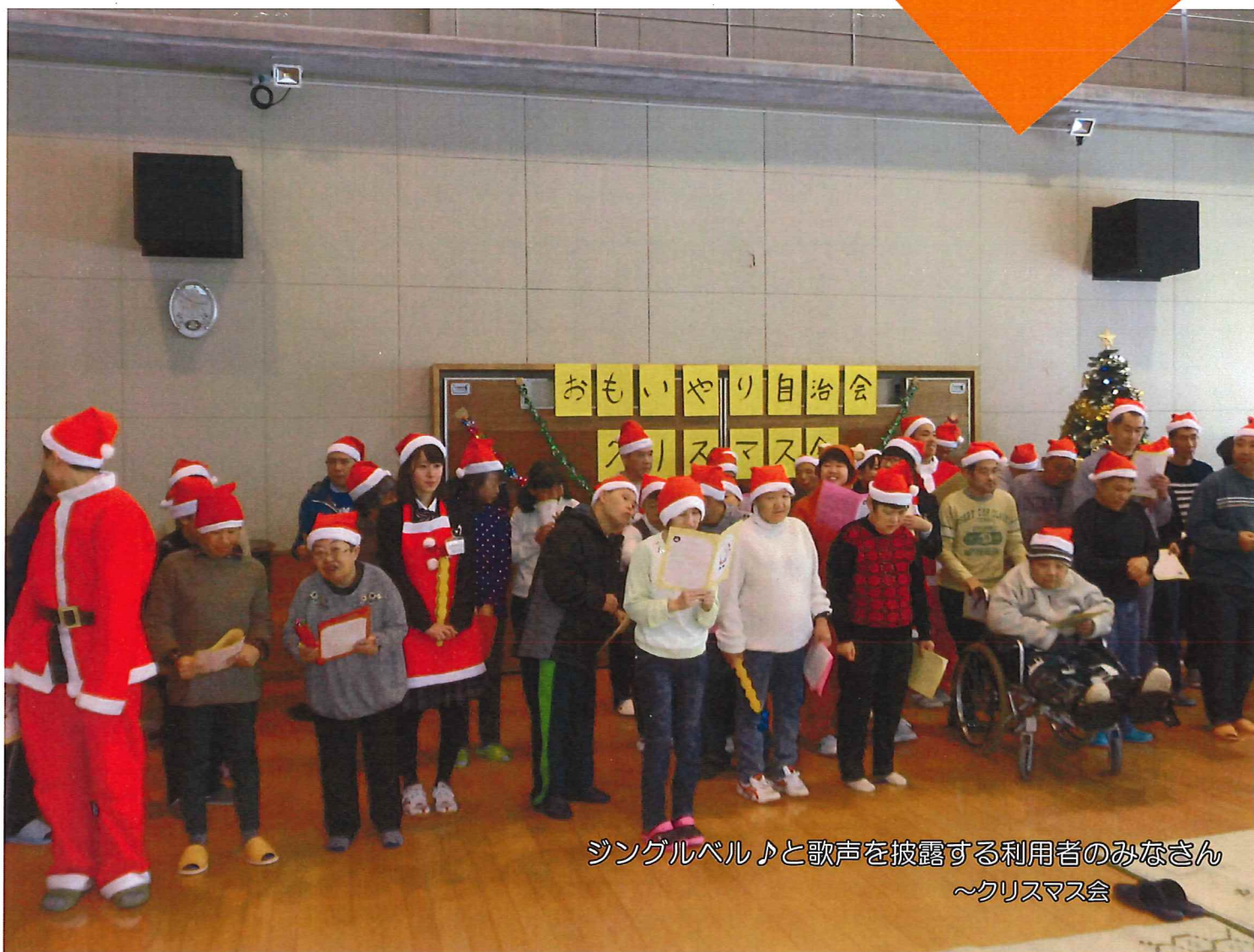
ジングルベル♪と歌声を披露する利用者のみなさん ～クリスマス会