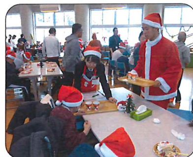
高校生ボランティアのみなさんの協力でスムーズに進みました