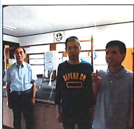
日頃のご協力に感謝いたします

森幸園のアルミ缶回収作業は、地域自治会の協力のもと行われており、利用者の「協力のお礼に自治会の力になりたい」という意思を尊重し、善意を届けてきました。今年度は、桂瀬地区にガス給湯器を贈呈させていただきました。今後感謝の気持ちを大切に作業に取り組んでいきます。