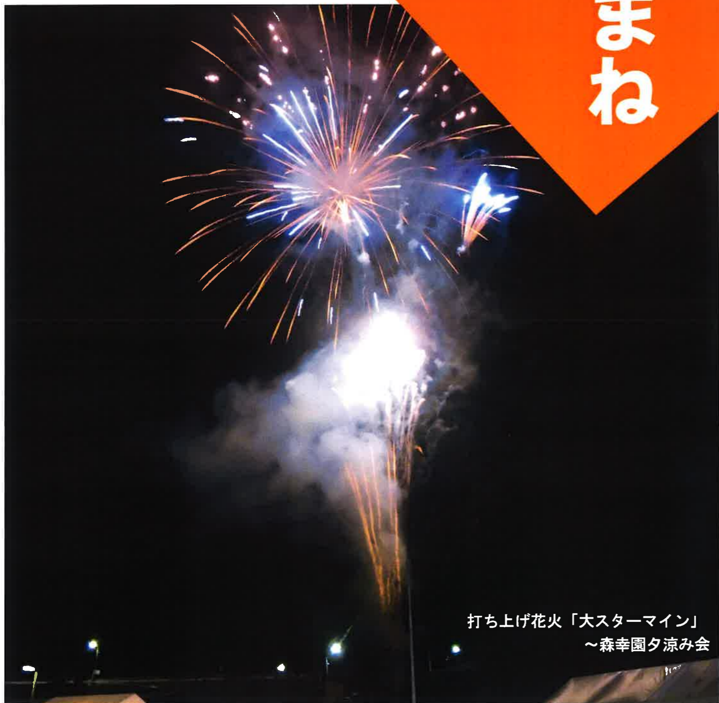
打ち上げ花火「大スターメイン」 ～森幸園夕涼み会