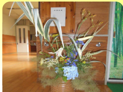
歓迎のフラワーアレンジメント