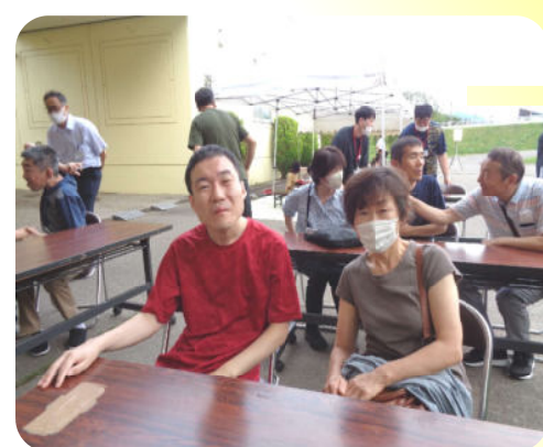
久しぶりの再会に思いがつのる...