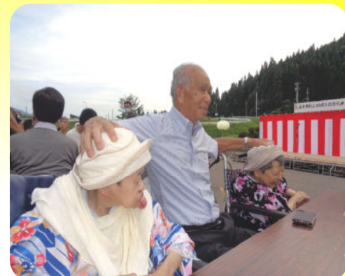
時がゆっくりと流れていく中で...