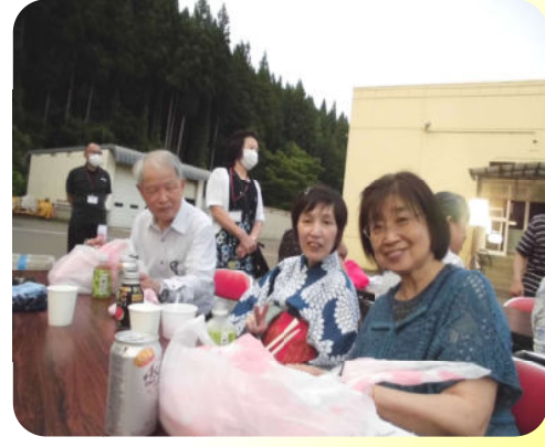
共に喜びを分かち合い...