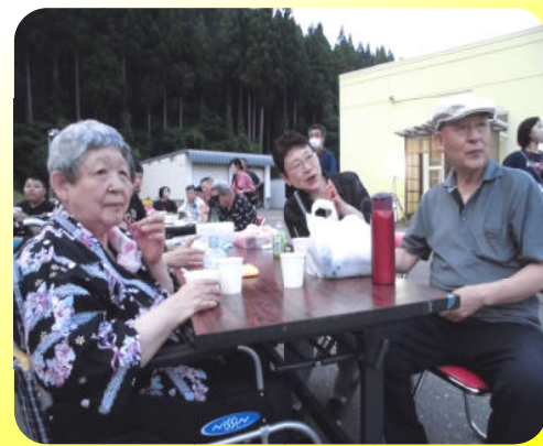
また逢うその日まで...