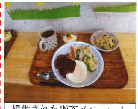
提供された喫茶メニュー!

初にどれから食べようか悩んでいる利用者もいました。古き良き昭和の喫茶店をイメージした食事の内容は『チキンライス・エッグハンバーグ・ペペロンチーノ・サラダ・パバロア』等、種類、ボリューム共に富んでおり、目でも皆さんを楽しませていました。