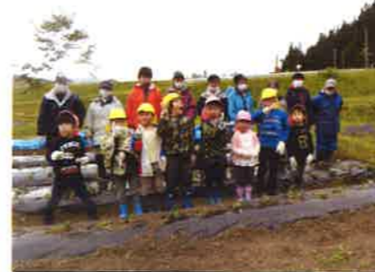
みんなで記念の写真撮影

雨が今にも零れて来そうなお天道様もこの光景を眺めていたのではありません。作業が終るとは、雨降る約束を交わしてしまいました。