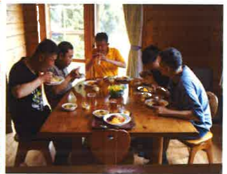
喫茶店気分を満喫!

初にどれから食べようか悩んでいる利用者もいました。古き良き昭和の喫茶店をイメージした食事の内容は『チキンライス・エッグハンバーグ・ペペロンチーノ・サラダ・パバロア』等、種類、ボリューム共に富んでおり、目でも皆さんを楽しませていました。