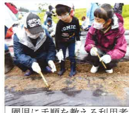
園児に手順を教える利用者