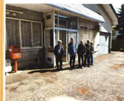
ハイツ前で最後の記念撮影

平成17年4月に生活実習棟として陣場岱ハイツを取得して約18年。家の老朽化や冬の除排雪の困難に伴いこの度解体する運びとなりました。