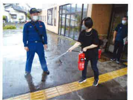
水消火器を使った消火訓練

6月28日、もりの郷において避難訓練が実施されました。北秋田市消防署から職員を派遣してもらい、サポーターホーム利用者及びデイサービス利用者を対象として実際の誘導方法や避難経路、対処方法などを訓練しました。参加した利用者は「実際に