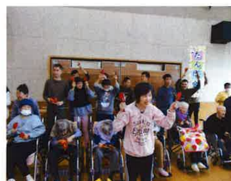
大ハッスルの踊り

興の開幕。歌に踊りに会場のボルテージは最高潮。歌に合わせて踊り出す利用者もいれば、我先にとカラオケを楽しむ利用者など、みんなで年に一度の催しを存分に味わい、楽しんでいました。