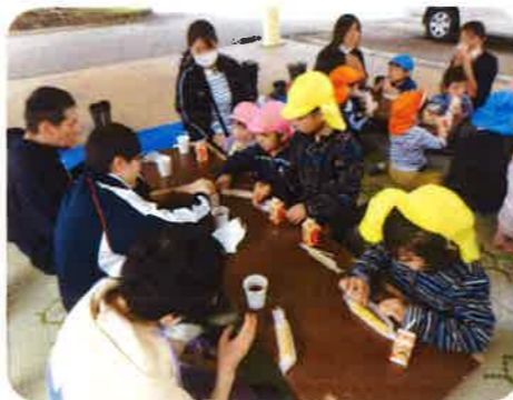
地鶏三昧に舌鼓する利用者

は互いに「大きいのいっばいある」などの声がかかれ、大収穫に満足していました。最後は全員でおやつを食べ、来年また会う約束を交わしていました。