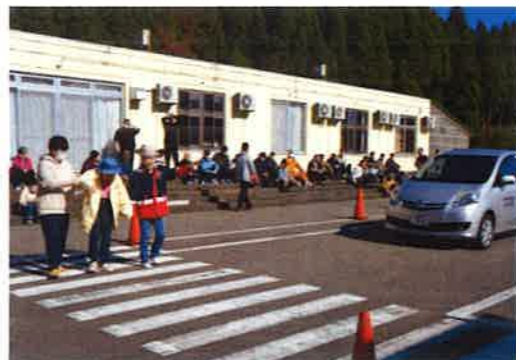
実際の横断歩道を渡る利用者

ら手を挙げて渡りましょう」とアドバイスを受け、利用者の皆さんは手順を守って渡っていました。