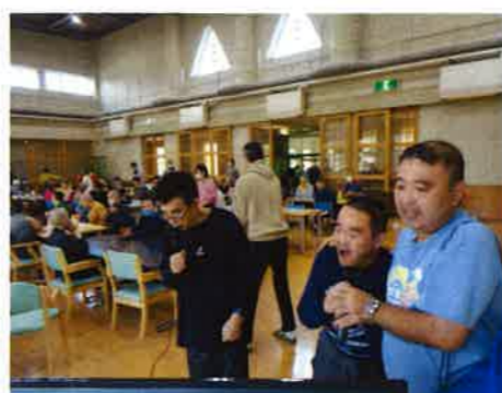
カラオケで大盛り上がり！

興の開幕。歌に踊りに会場のボルテージは最高潮。歌に合わせて踊り出す利用者もいれば、我先にとカラオケを楽しむ利用者など、みんなで年に一度の催しを存分に味わい、楽しんでいました。