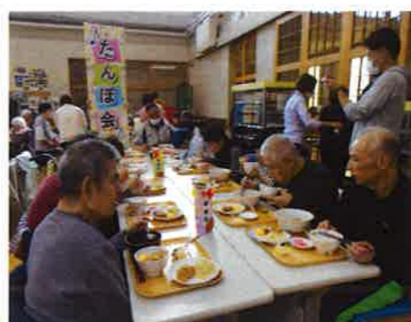
地鶏三昧に舌鼓する利用者

例年であれば新米のきりたんぼですが、今年は趣向を変えて『比内地鶏』をふんだんに使った炊き込みご飯が振る舞われ、また。他にも鶏の唐揚げや特製スープなど、正に鶏三昧。利用者の皆さんはいつもと違ったこの豪華なメニューに舌鼓していました。食事が終わった後は余