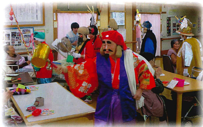
根森田七福神の皆さんから福をわけてもらいました

根森田七福神の七人の神 様が舞いながら、利用者 の方々に福を授けて頂きま した。 運を試す宝引きも行な われ、昔ながらの正月遊び を楽しみました。