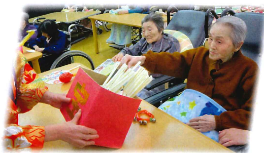
どれにしようかな～