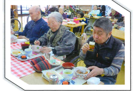
おいしいね・・・