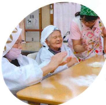
慣れた手つきでお供えを作ってもらいました