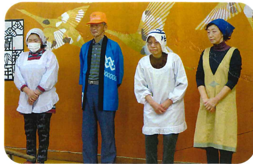
下前田自治会の皆さん