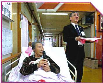
▲お誕生日おめでとうございます▲