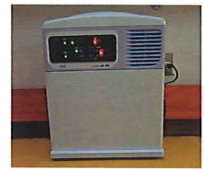
空気清浄器 オゾンエアクリア3台