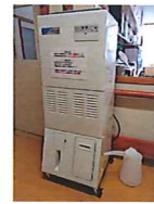
加湿器 ナノフィール2台