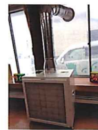
陰圧装置 エアウォーター