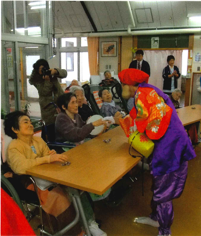
▲福をわけてもらいました

施設では月ごとに季節に合った行事を行っています。利用者の方々が交流を深め、楽しみ、喜んでいただける様工夫しています。 新年会には七福神が来荘され利用者の皆さんと宝引きを楽しみました。