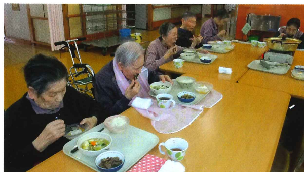
▲皆さんで作った、たら鍋、絶品!!