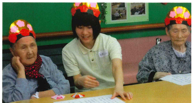
▲実習生と記念に一枚