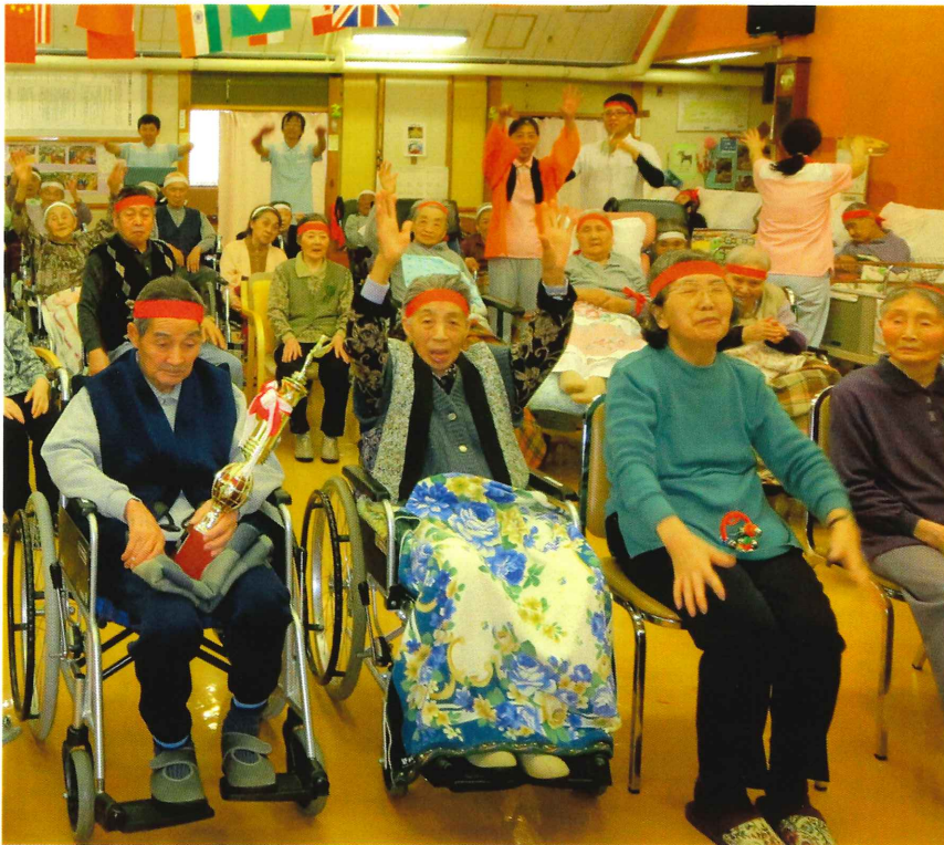
▲最後は皆さんで万歳三唱

二月はだまつこ鍋やら鍋を利用者のみなさんに作って頂いたり、節分では本物さながらの鬼が登場しました。 なんといつても紅白対抗レクリエーション大会では、若い頃に戻り、玉入れやボール渡しに熱中していました。