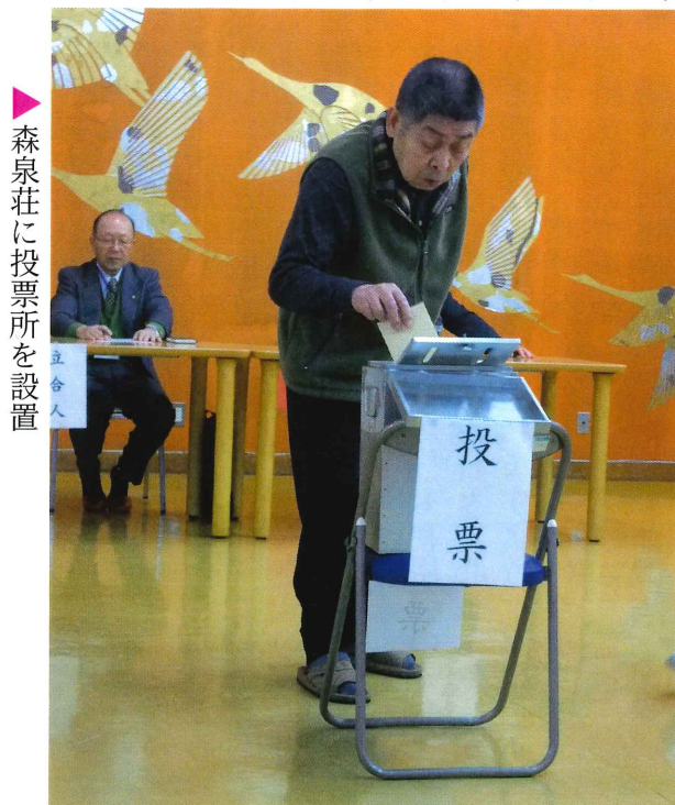
▶森泉荘に投票所を設置

三月はひな祭り行事があり、折り紙で雛人形を作り歌つこを唄いながら楽しみました。 北秋田市市議会議員選挙では思いを込めて投票しました。