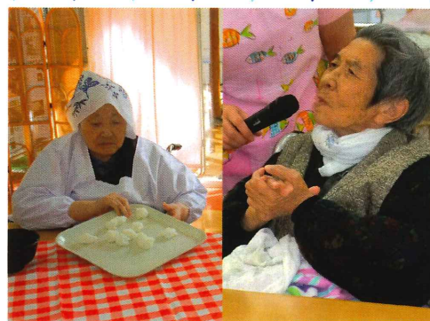
▲だまっこ鍋の作り方を実況中