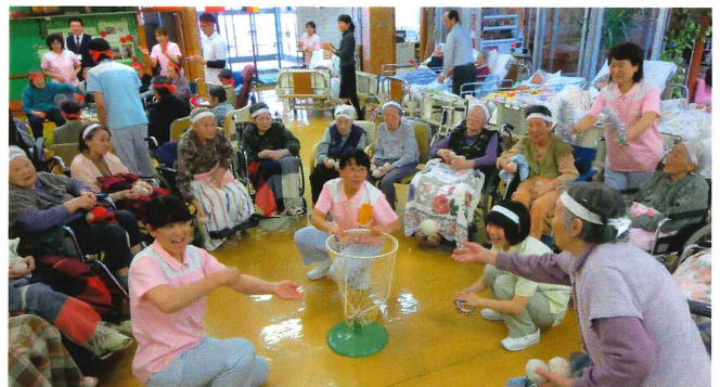
▲カゴをめがけて・・・