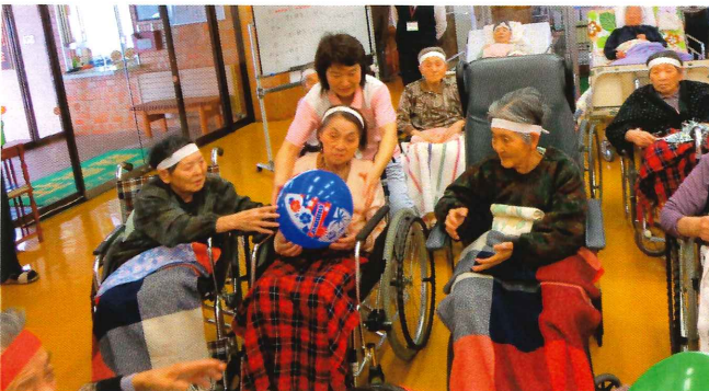
▲次の方へ慎重に・・・