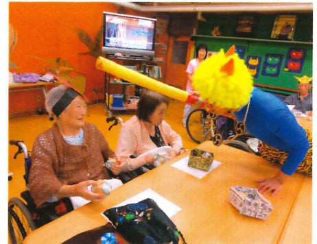
▲新聞紙の玉で鬼を退治

二月はだまつこ鍋やら鍋を利用者のみなさんに作って頂いたり、節分では本物さながらの鬼が登場しました。 なんといつても紅白対抗レクリエーション大会では、若い頃に戻り、玉入れやボール渡しに熱中していました。