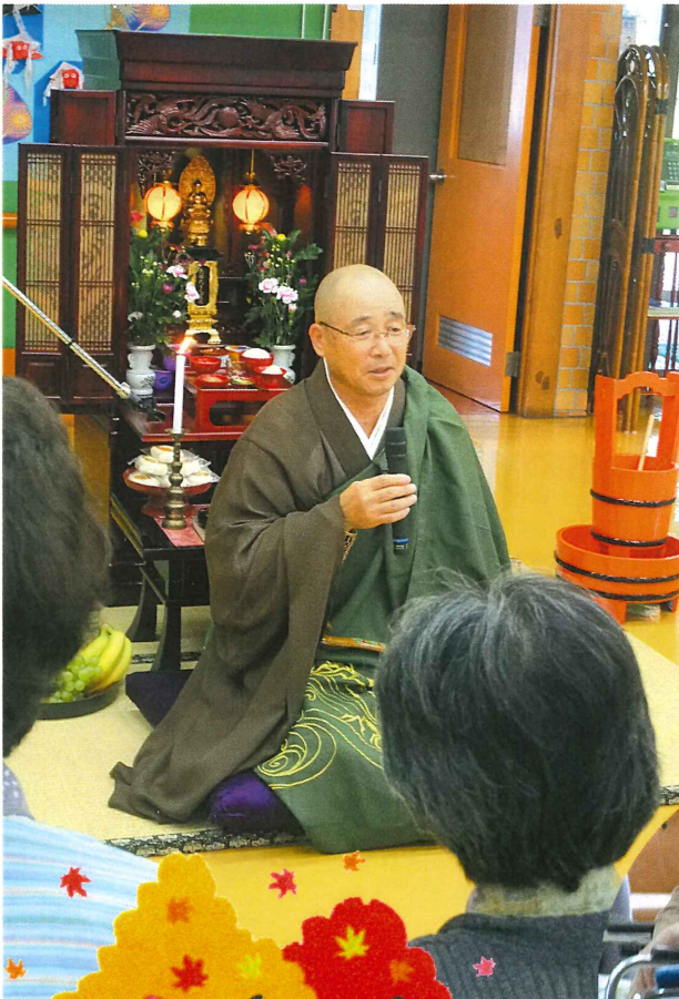
〈盆供養〉 今年も福寿寺の奥山住職に、ご先祖様の供養をして いただきました