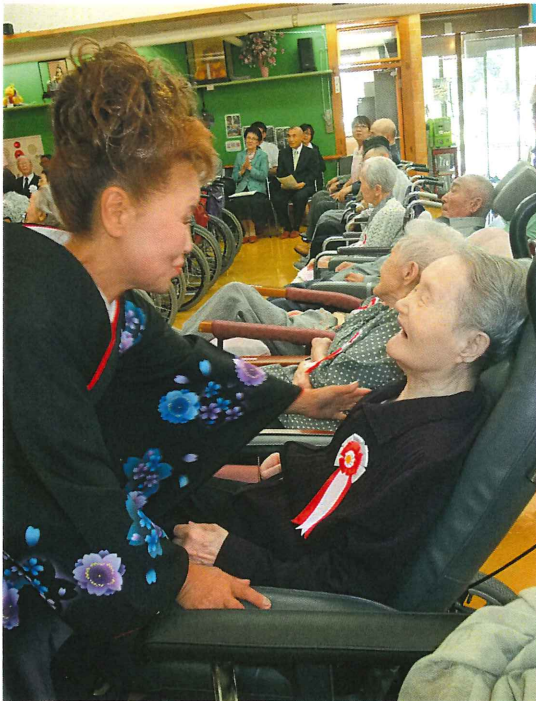
▲「歌っこ、いがったよ」と笑顔で・・・