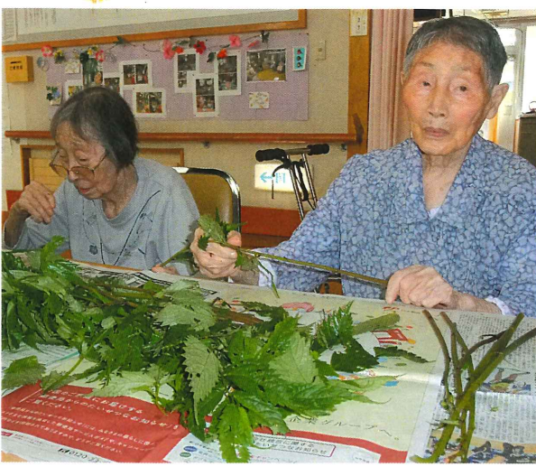
▲ 昔はいっぱい採ったもんだと 馴れた手つきでミズの皮むき