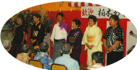
▲素晴らしい歌ありがとうございました