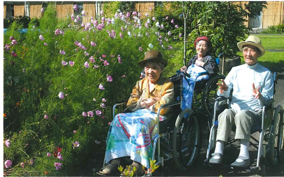
〈散歩〉 ▲天気が良い日は庭で 日光浴です。気持ちよさそ うです