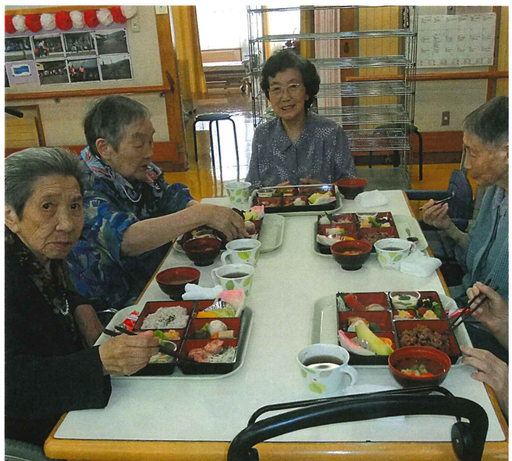
▲調理方法を工夫して、見た目も華やかな御祝い膳。皆で美味しく頂きました