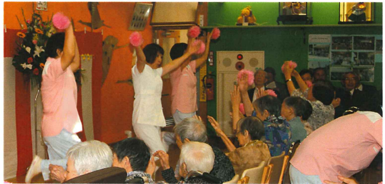
▲森泉荘音頭、日頃の練習の成果を披露