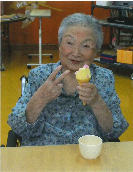
▲暑い日はババヘラアイスに 限ります