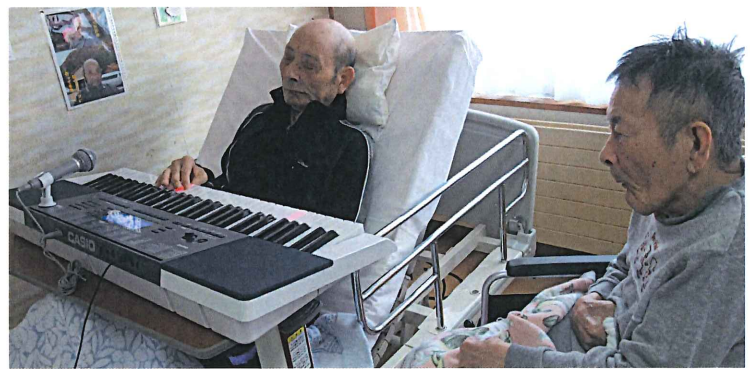
▲電子ピアノでうっとり…。