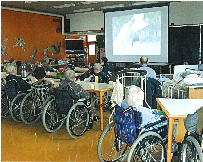
▲大きなスクリーンで映画を鑑賞

四季折々の自然にふれたり行事やレクリエーションでは大活躍。利用者さんの活き活きとした笑顔をお届けします。