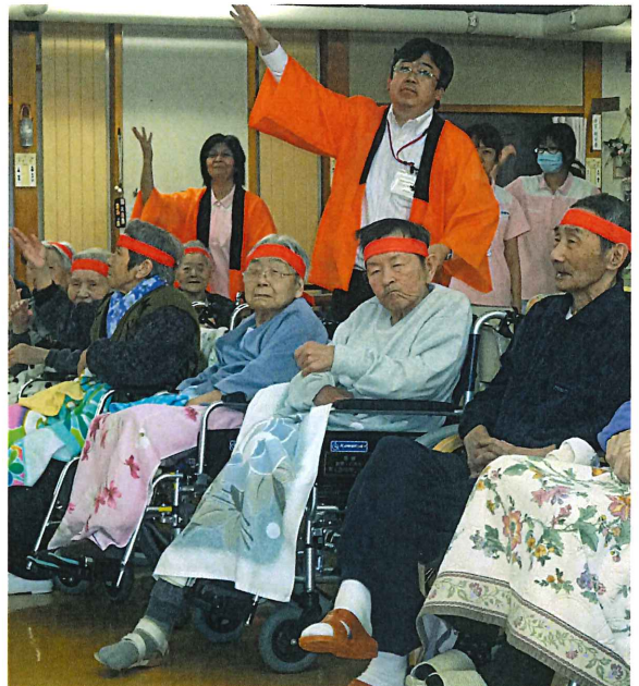
▲レクリエーション大会。赤組と白組に分かれてたくさんのゲームを行いました