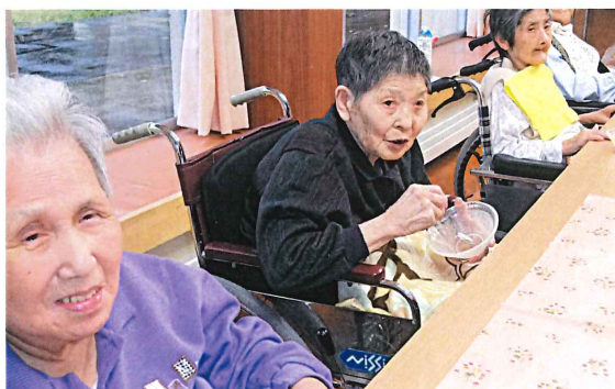
▲今年から始めたヤマネでのお茶会