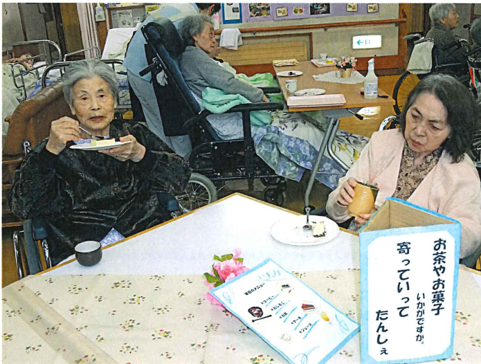
▲喫茶いずみに参加し、「おいしい」と話す利用者さん