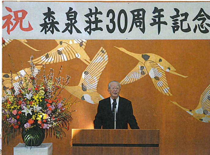
▲理事長よりお祝いの言葉を頂き 皆さん感謝でいっぱいでした