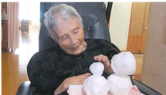
▲「しゃっけなあ〜」と雪だるまに触れる利用者さん