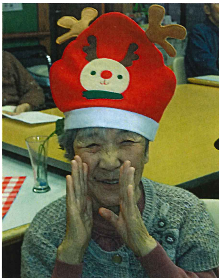
▲クリスマス会では歌ったりプレゼントをもらってウフフ