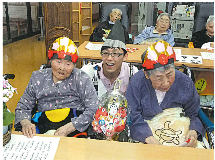
▲実習生と一緒にひな祭り