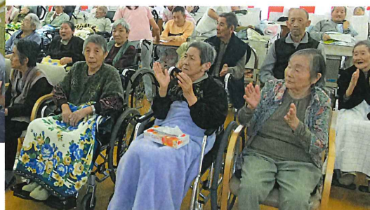
▲すばらしい歌声に涙が出て 拍手、喝采