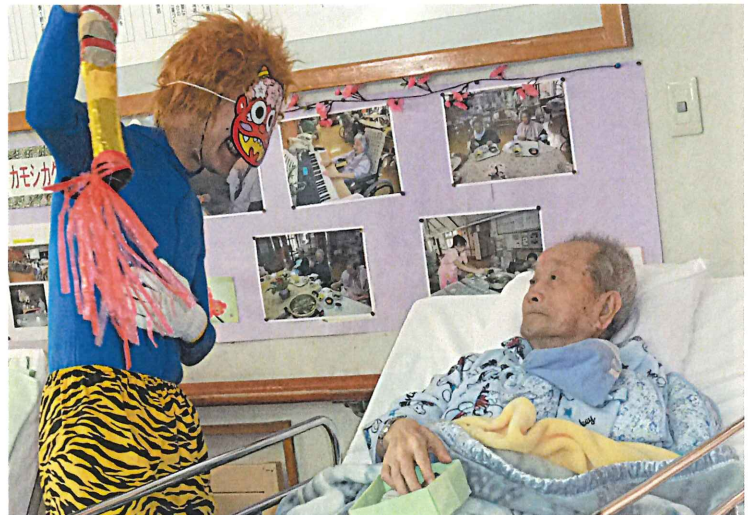
▲節分では鬼の迫りにタジタジの利用者さん