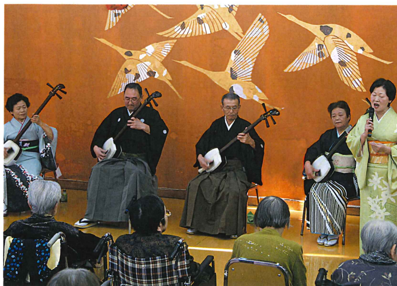
▲前田民謡同好会の皆様 素敵な音色をありがとうございます