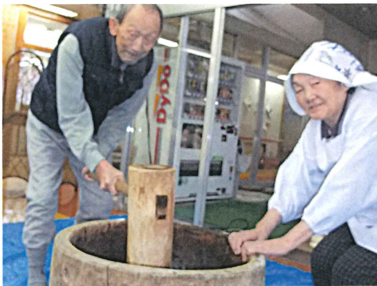
▲さすが息ピッタリ