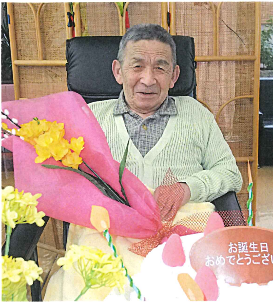
▲毎月行われる誕生会。カメラを向けるとニコリ