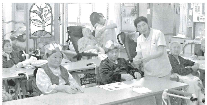
▲ 3月3日：ひな祭り ▲