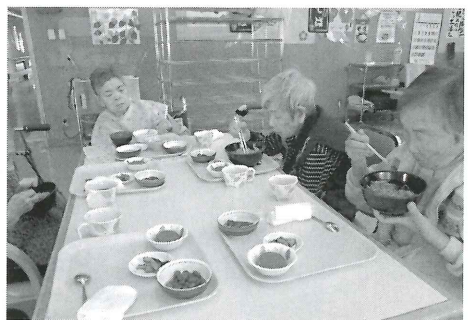
▲ おいしく頂く利用者さん