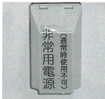
▲ 廊下に設置されたスイッチ