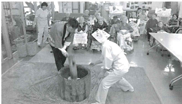
▲ 12月27日：もちつき ▲

森泉荘では毎年、昔ながらの行事が開催され、年始めには恒例の宝引き大会があり、クジを引き一年の運だめしをしながら賞品を手に取り喜んでいました。 もちつき大会では、元気な声掛けと共にもちつきをし、皆さんで上手に丸めておいしく頂きました。 二月三日は節分で、積極的に鬼に玉を当て、福を呼びました。 三月二日、桃の節句を祝うひな祭りがあり、職員と一緒におり紙でおひな様を作りながら、施設内で一足早く咲いた桜を眺め、春の訪れを感じた一日でした。