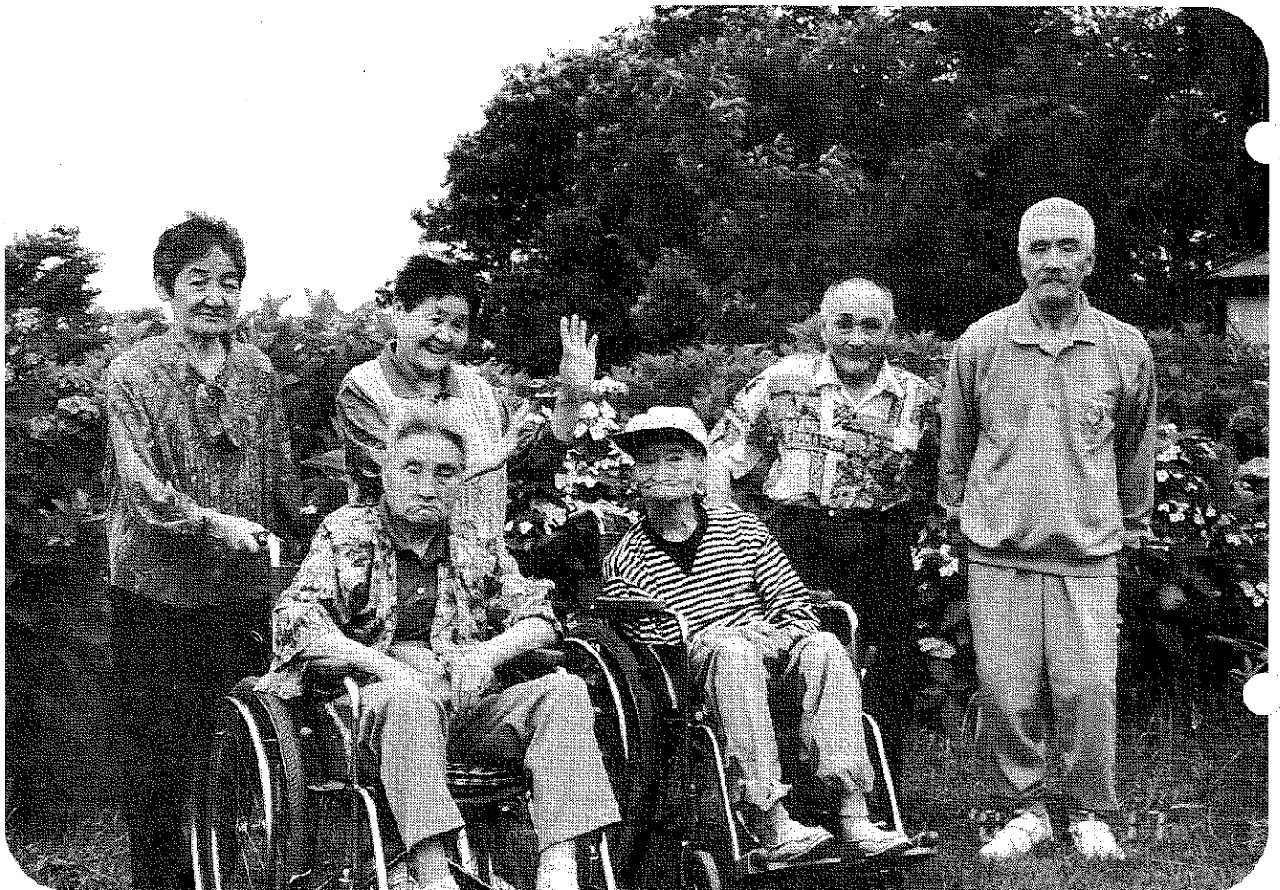
合川町あじさい公園にて