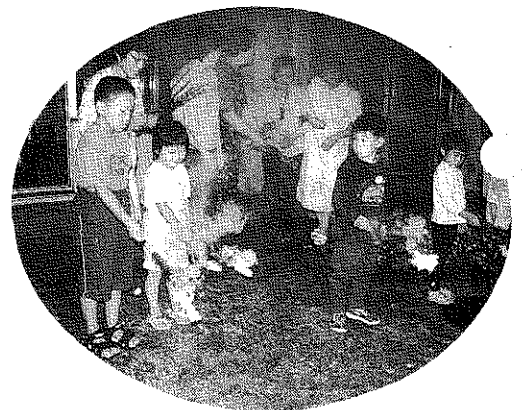
地域の子供達も参加した花火大会