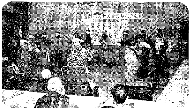
楽しい踊りに、食事の介助もして頂いた コスモス会のみなさん。