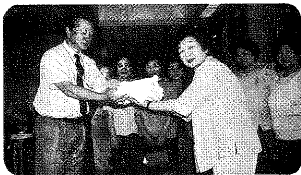
今年もありがとうございます。森吉町婦人会のみなさんよりタオルをたくさんいただきました。