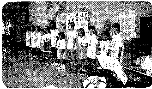
浜辺の歌青少年少女合唱団のさわやかな歌声に聞き入りました。