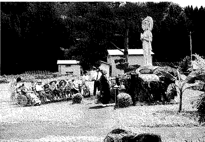
みんなで合掌。盆供養。