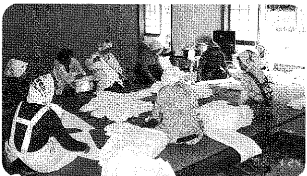
いつも助かっています。オムツたたみの作業奉仕