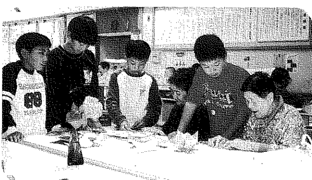
前田小学校5年生との交流会。 みんな楽しみにしています。