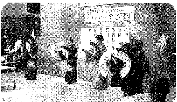
日舞鳳扇会のみなさんによる華やかな舞い。