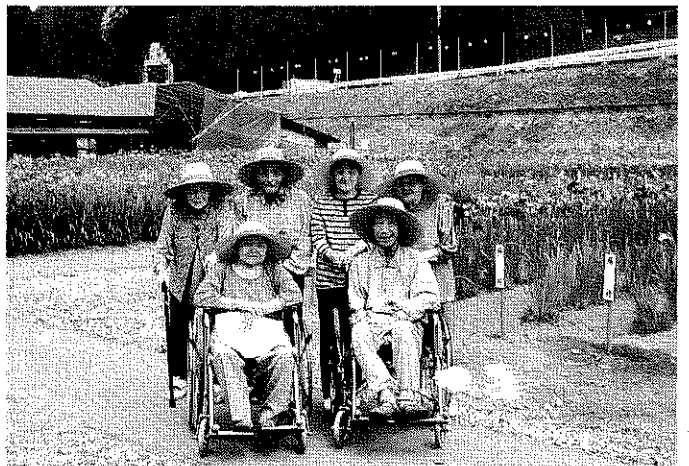
菖蒲園ドライブ。キレイな菖蒲の前でニッコリ。