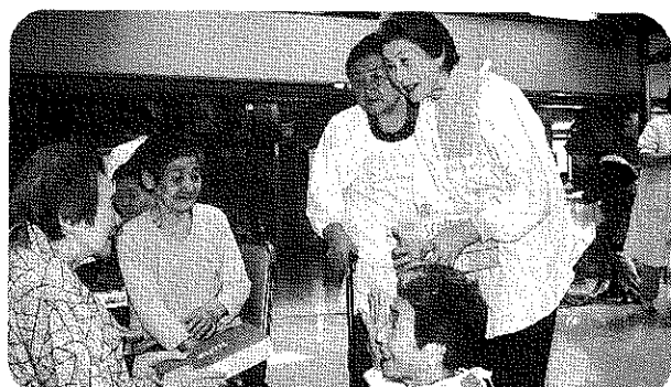
前田更正保護婦人会のみなさんが利用者一人一人に ティッシュペーパーをくださいました。