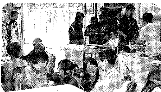
米内沢高校1年生によるふれあい体験学習。 明るい笑顔に利用者も若がえります。