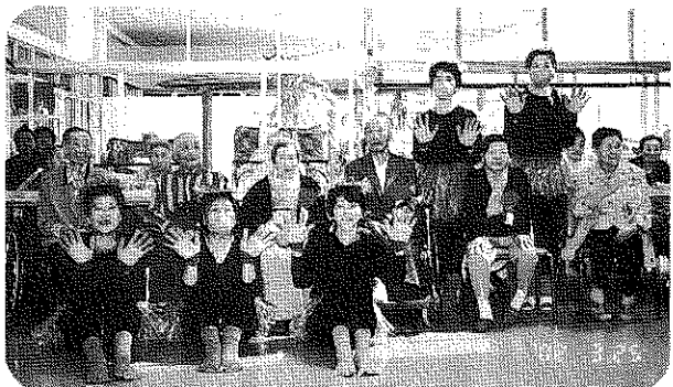
新屋布なでしこ会の楽しい踊りに、利用者もニコリ