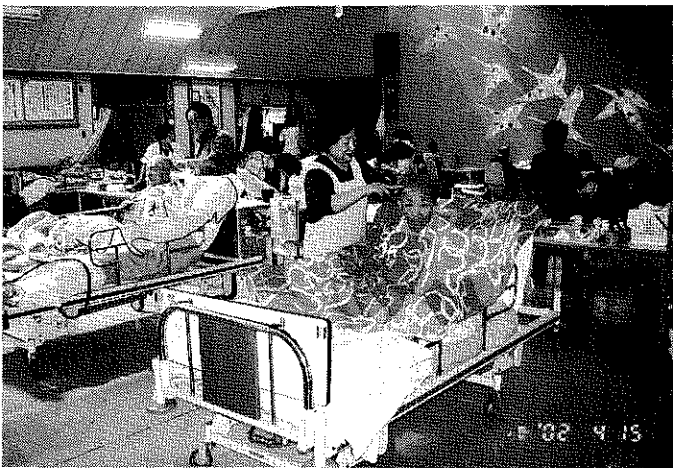
すてきなカットで頭すっきり。