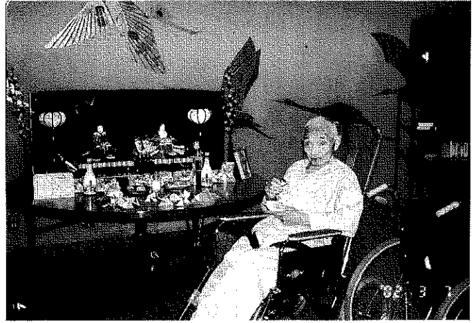
男でも、ひな祭りはえ〜もんだすなア。