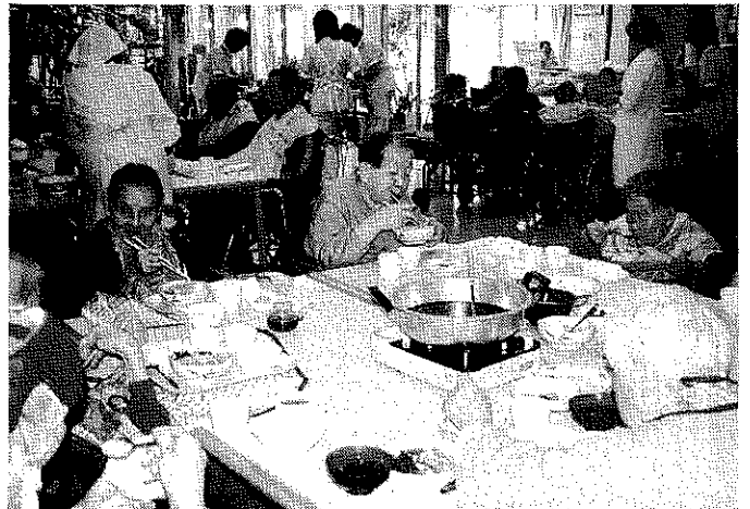
みんなで鍋を囲むと食も進みます。