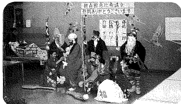
笑いが止まらなかった。 根森田恵比寿講のみなさんの芸の披露。