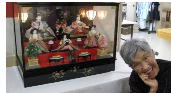
うっとりしてしまいます

3月に入ると雪も落ち着き、地面が顔を出してきた。晴れの日も増え、気分が向上してくる。ひな祭りでは歌を唄い、美味しいお菓子を味わい、ひな人形を鑑賞した。飾り付けも桃色中心で春を一味先に味わった気分だった。