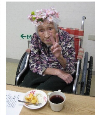
花冠似合うかしら?