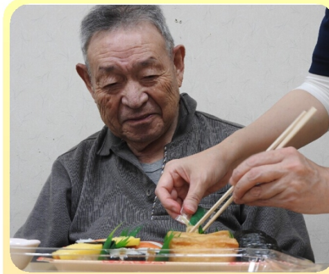
思わず表情がゆるむ

新型コロナウイルス。話題にならない日はないほど我々の生活に影響している。予防対策に多くの制限を設け、流行前の生活から変わってしまった。そんな状況でも食に娯楽に楽しみを見つけて頂こうと様々な企画を行った。寿司を注文して昼食に提供した寿司パーティーでは、久しぶりの寿司にいつもより箸が進む皆さん。食べる前から楽しみでニコニコされる方も。ドライブでは飲食こそ車内だが、散策には人がいない場所を選びゆったりと散歩して頂いた。普段の生活の中でも微笑ましいひとコマが数多く見られ、思わずカメラを向けてしまう。多くの経験を積まれた皆さんは日常を楽しみむことが上手だった。