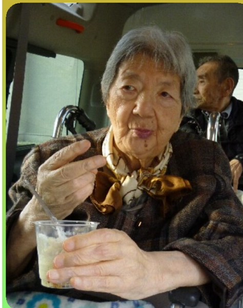
スイーツで気分上々♪