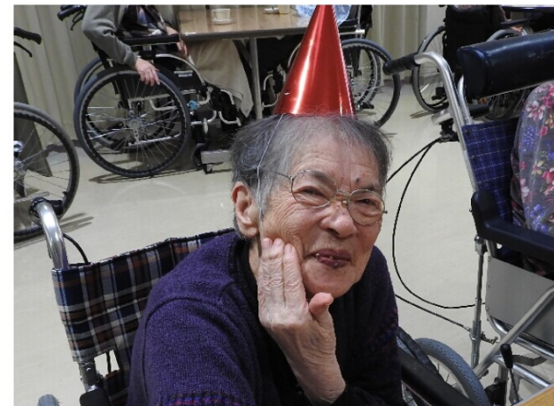
ほっぺが落ちちゃう?

年末の楽しみクリスマス。豪華な食事にクリスマスプレゼントのお楽しみ会を開催した。それぞれのユニットで特色のあるゲームや催し物を行い、賑やかな笑い声が施設内に響き渡った。料理に舌つづみする方やゲームに熱中する方、それぞれ楽しみ方でクリスマスを過ごされていた。 「星が降っているようだ」とつぶやく声に、皆で外の雪をしみじみと眺めていた。