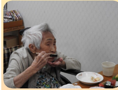
ごちそうに箸がとまらない皆さん