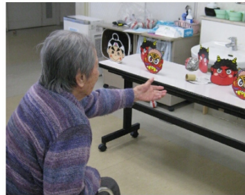
鬼たいじゲームに熱中

立春の前日、分節。春が待ち遠しい寒さが続く日に元気な声で「鬼はく外! 福はく内!」と分節行事が行われた。 手造りの恵方巻模型でポーズを取ってもらい写真撮影。丸かじりする方や見通すような仕草の方など様々であった。豆まきでは、鬼のお面を倒して遊ぶゲーム等、工夫された豆まきで盛り上がった。 「恵方巻、まるっと一本食べたいな」「落花生だばよく食べたもんだ」等会話に花が咲き、楽しそうな様子に邪気も退散したようだ。