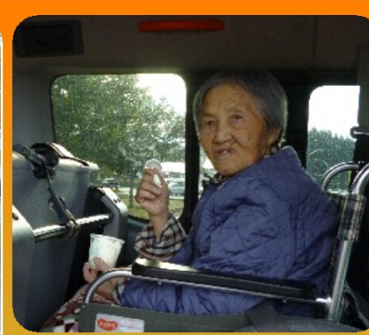
車窓に届く木漏れ日