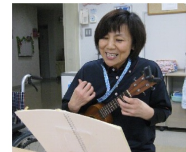
職員によるメドレー

年末の楽しみクリスマス。豪華な食事にクリスマスプレゼントのお楽しみ会を開催した。それぞれのユニットで特色のあるゲームや催し物を行い、賑やかな笑い声が施設内に響き渡った。料理に舌つづみする方やゲームに熱中する方、それぞれ楽しみ方でクリスマスを過ごされていた。 「星が降っているようだ」とつぶやく声に、皆で外の雪をしみじみと眺めていた。