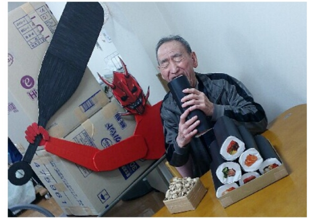
ガブリといただきます

立春の前日、分節。春が待ち遠しい寒さが続く日に元気な声で「鬼はく外! 福はく内!」と分節行事が行われた。 手造りの恵方巻模型でポーズを取ってもらい写真撮影。丸かじりする方や見通すような仕草の方など様々であった。豆まきでは、鬼のお面を倒して遊ぶゲーム等、工夫された豆まきで盛り上がった。 「恵方巻、まるっと一本食べたいな」「落花生だばよく食べたもんだ」等会話に花が咲き、楽しそうな様子に邪気も退散したようだ。