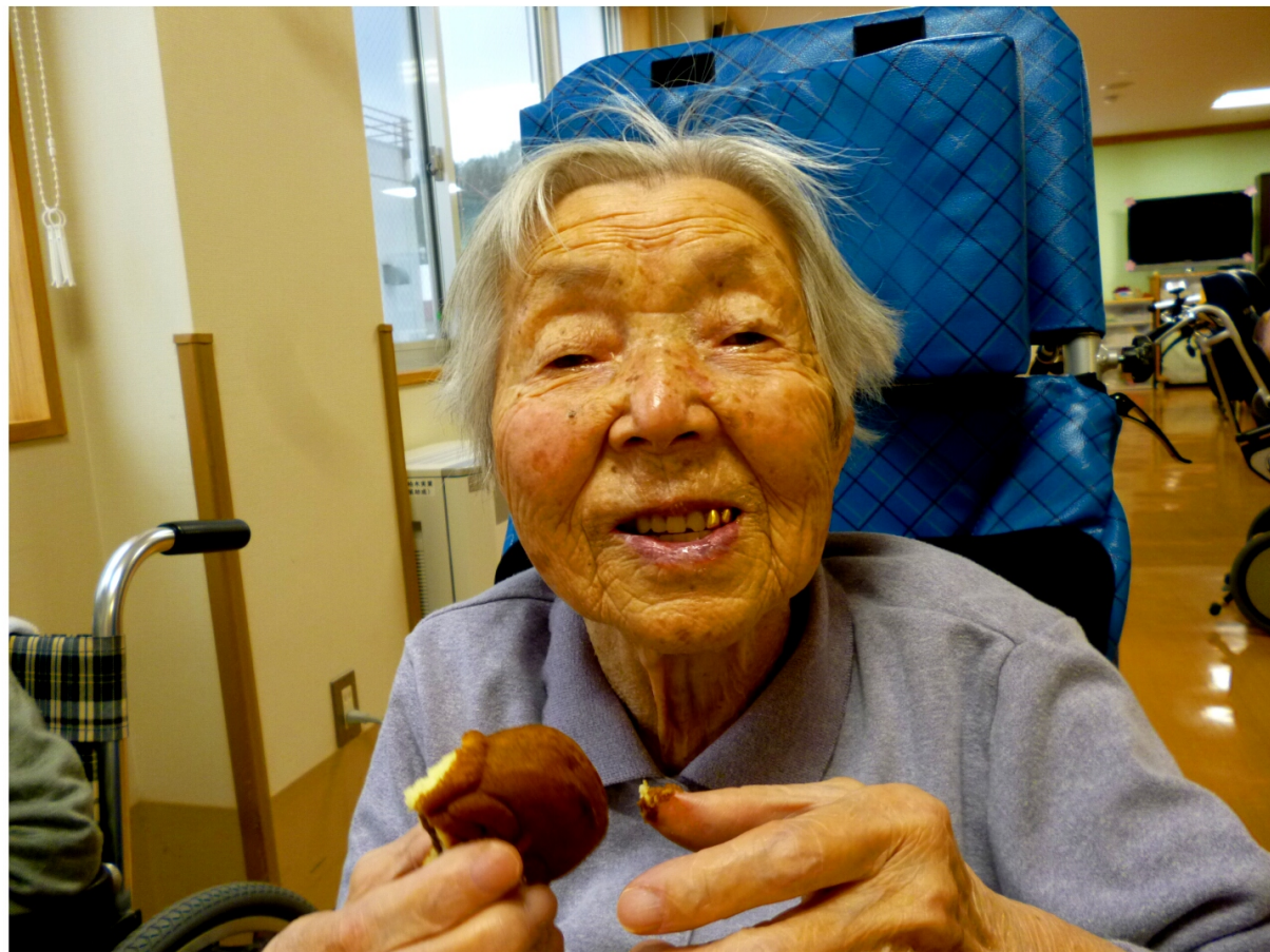
元気の秘訣? のんびり時々あまいもの