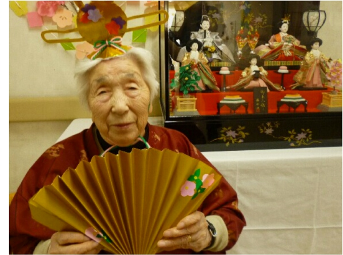
黄金の扇を広げて