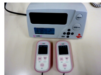
ナースコール設備取替