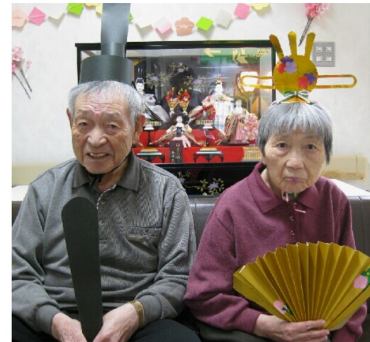
ホンモノ？お内裏様とお雛様