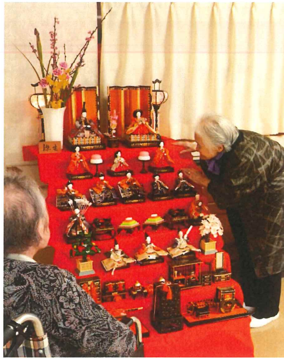
飾られたひな壇を眺める利用者

もりよし荘では例年より遅く雛人形の飾り付けが行われた。待ちわびている女性陣からは「散り際の花が沢山居るからって…」と皮肉を込めた言葉が出るくらい雛人形を楽しみにしてくれている様子だった。