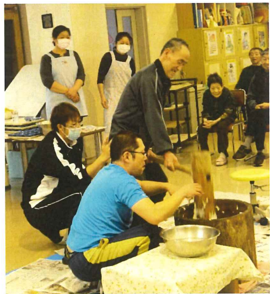
利用者も杵を握って挑戦

12月26日、もりよし荘でもちつき会が開かれ、昔ながらに臼ときねを使ってついた餅をお汁粉にして味わった。施設では一年の最後を締めくくる恒例行事で多くの利用者がホールに集まった。餅つきは初体験の職員に利用者から「きねをぬらさない」と餅がくつつく「もっと腰を入れて」とアドバイスをされる場面も。自ら餅つきする利用者もおり「よいしょ」とかけ声が飛んでいた。