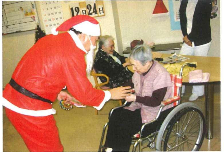
プレゼントを受けとる利用者

が去った後は、いつものクリスマスケーキが振舞われ、「あえり、うめごど」といふものおやつよりじつくりと味わって食べられていた。