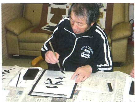
真剣な表情の利用者