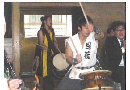
圧倒されたバチさばき

12月3日、比内養護学校の鷹巣分校体育館で、なまはげ太鼓の鑑賞会があった。見事なバチさばきに、見学