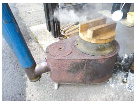
薪ストーブでごはんを炊く

11月17日リハビリ主催の「昔を思い出し皆でごはんを作る会」が行われた。当日は少し寒い日でしたが、屋外に薪ストーブとつば釜