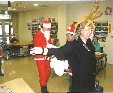
眼鏡をかけたトナカイ達

12月24日クリスマス会が行われた。全国的に流行している感染症の予防の為に各ユニットにサンタクロースが回り、職員が扮したちよつぱり太目のサンタクロースや、眼鏡をかけたトナカイ達が利用者一人ひとりにプレゼントを手渡して歩いた。プレゼントを受け取った利用者は「なんだべが、ありがとう」と受け取って、すぐに中身を確認する利用者もいた。サンタクロース