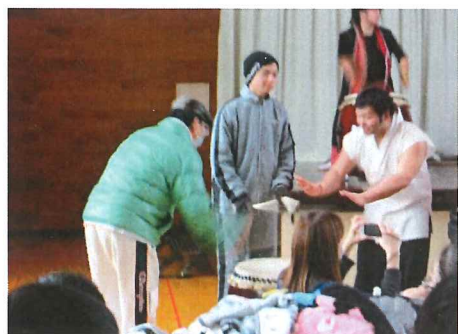
なまはげ太鼓を叩く利用者