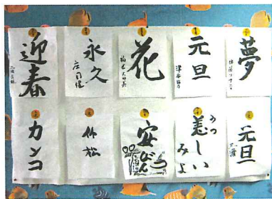
利用者の皆さんの力作

12月、リハビリの一環として今年も書道大会が開催された。皆、昔を思い出しながら、明鏡止水のように心を研ぎ澄まして、思い思いの言葉を書き上げた。自分の作品に納得がいかず、「もう1枚だけ、書いても