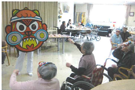
鬼の面に豆を投げる利用者

毎年恒例の行事となつている節分の豆まきが、2月3日に行なわれた。全ユニットで邪気を払い皆の健康を祈り豆まきをした。大きな顔の鬼のめがけ、「鬼は外、福は内」と元気よく笑顔で豆をまいた。利用者は、「みんなで豆まきして体の悪いところ追い出したから、みんなますます元気になってしまふな」と笑顔で話していた。